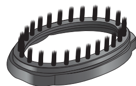
Escova para tecidos