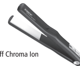
Taiff Chroma Ion

Este produto não é brinquedo, mantenha-o fora do alcance de crianças.