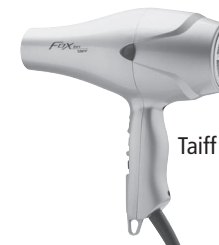
Taiff Fox Ion