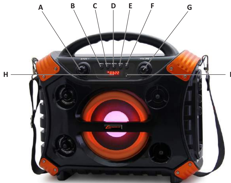
O aparelho visto de frente