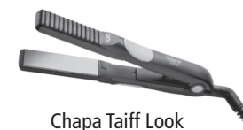
Chapa Taiff Look