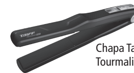
Chapa Taiff Tourmaline Ion