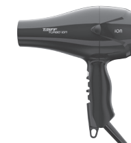
Secador Taiff Turbo Ion

Este produto não é brinquedo, mantenha-o fora do alcance de crianças.