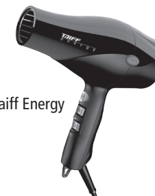
Secador Taiff Energy