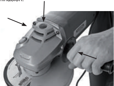
Posibilidad de encaje en las laterales y en la parte superior

- Se puede enroscar el mango auxiliar en las laterales para trabajos de corte, desbaste y terminación.