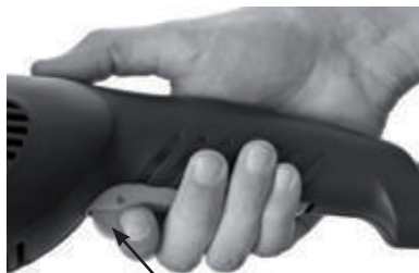
Botão Trava do gatilho