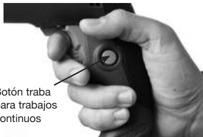
Botón traba para trabajos continuos

- Para facilitar la operación y evitar la fatiga del usuario durante las aplicaciones continuas de larga duración, puede usarse el botón de traba. Después de apretar el gatillo, apriételo para mantener la herramienta en funcionamiento sin necesidad de apretarlo. Apriete el gatillo de nuevo para destrabar la herramienta.