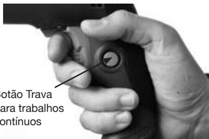
Botão Trava para trabalhos contínuos

- Para facilitar a operação e evitar a fadiga do usuário durante aplicações contínuas de longa duração, o botão de trava pode ser utilizado. Após pressionar o gatilho, aperte-o para manter a ferramenta em funcionamento sem a necessidade de pressão no gatilho. Pressione o gatilho novamente para destravar a ferramenta.