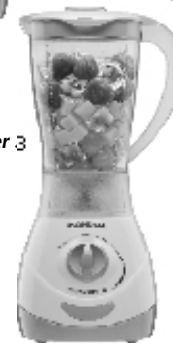
NL-32 – Power 3 3 Vel. Copo SAN