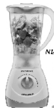
NL-22 – Power 2 2 Vel. Copo SAN