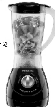
L-28 – Power 2 Black 2 Vel. Copo SAN