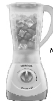
NL-26 – Power 2i 2 Vel. Copo PP inquebrável